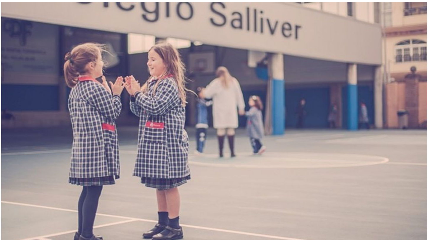
Colegio Salliver (Málaga)

El idioma oficial del centro es el castellano , aunque un 50% del profesorado utiliza el inglés como lengua vehicular.