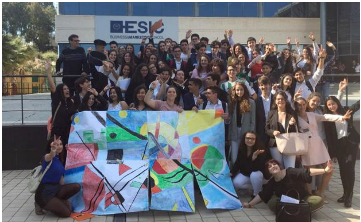
Grupo de jóvenes premiados en la fase provincia.

La novena edición de este encuentro ha reunido a doce centros de Bachillerato de la provincia