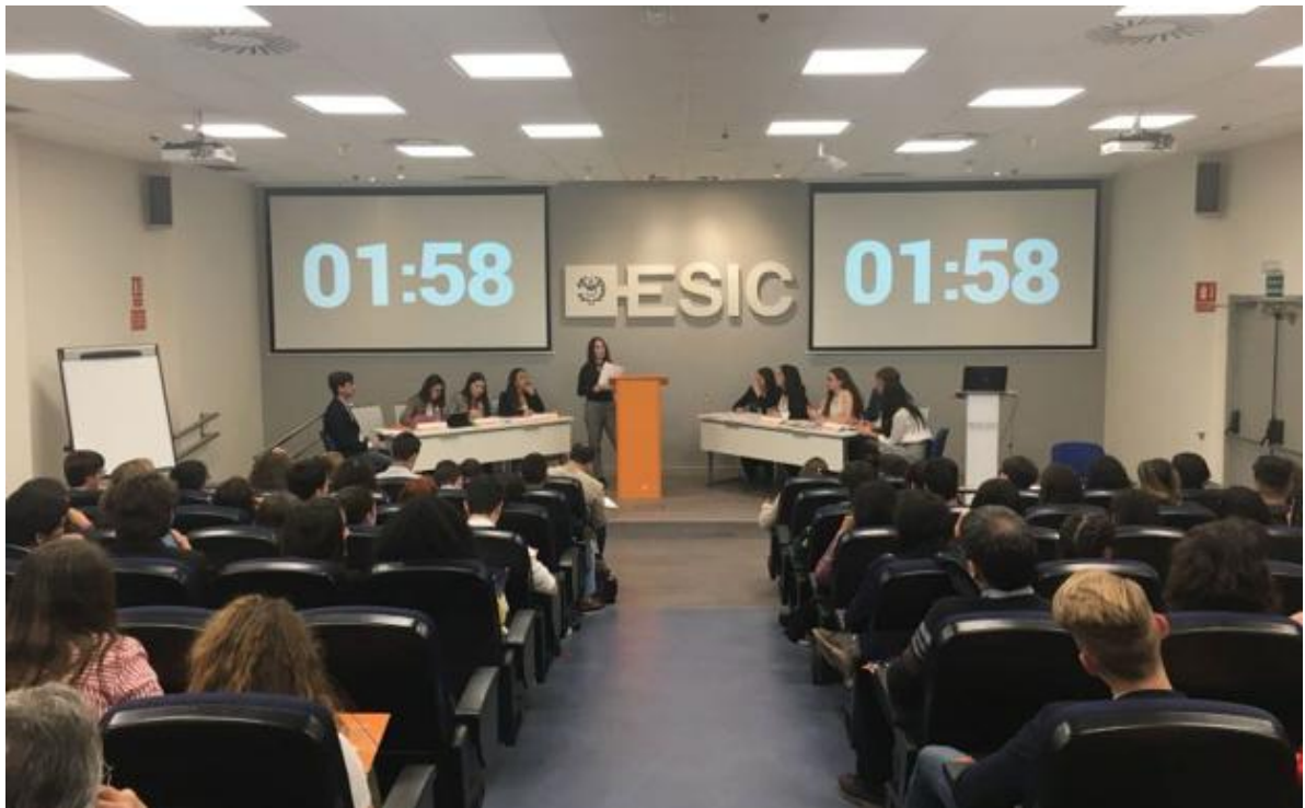
Un momento de los debates en el centro ESIC de Málaga.

Jóvenes Promesas es un programa para docentes y jóvenes de bachillerato que celebra en 2018 su novena edición en 24 provincias de España. En cada una de ellas, propone la resolución de un reto de futuro global para empoderar a los jóvenes y convertirlos en líderes mediante el fomento del pensamiento crítico y la participación social. Tres fases son las que conducen a los participantes en esta dirección: pensar, hablar y hacer.