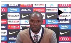
Abidal: "No estamos aquí para hablar la decisión de un jugador, sino para montar un equipo competitivo"