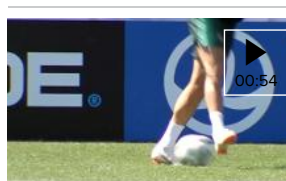
Último entreno de Portugal antes de jugar contra Marruecos