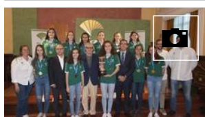
Orgullo del Unicaja por su Infantil Femenino, campeonas de España