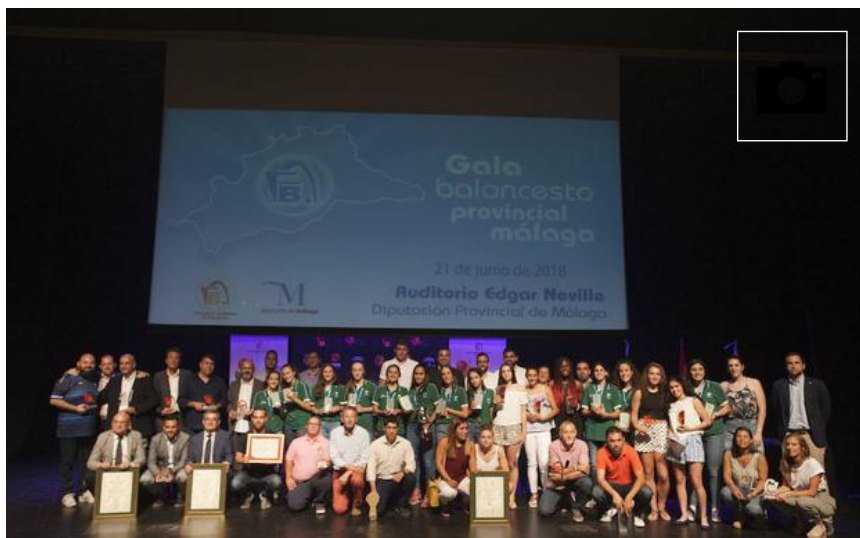
Foto de grupo de todos los premiados ayer por la Federación Andaluza de Baloncesto.