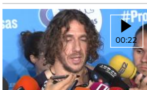
Puyol: "No entiendo el malestar de la afición culé con Pique"