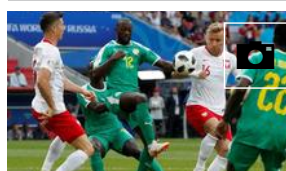
Polonia-Senegal, en imágenes